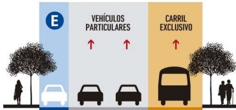
CON ESTACIONAMIENTO [Córdoba, de Vera Mujica a Bv. Oroño]